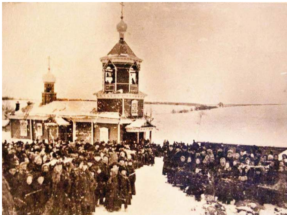
Церковный праздник в Ёлкино. Начало 20 века.