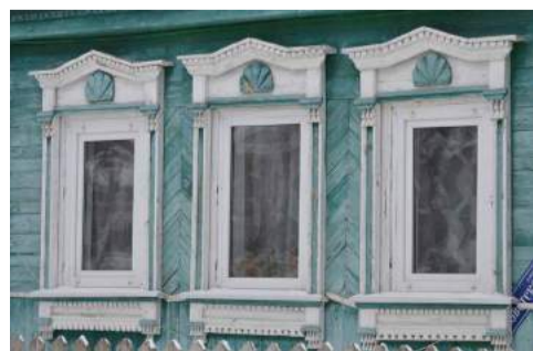
Хорлово, ул. Советская, д. 130

Мы попробовали взглянуть на несколько домов, находящихся в городском поселении Хорлово, «незамыленным» взглядом и показать их такими, какими увидели.