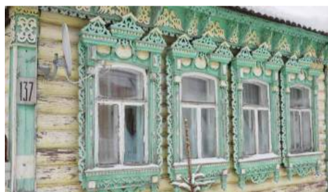
Хорлово, ул. Советская, д. 137

Форма наличника с таким верхом (навершие, состоящее из трех частей) встречается не только в Московской области, но и в республике Мордовии, в Пензенской и Костромской областях. А вот то, что находится под козырьком «крыши», скорее всего, является стилизованным кругом – «солнцем», с расходящимися от него лучами. Солнце – главный символ язычества. Схематичное изображение или знак в виде солнца принято называть «солярным» символом.