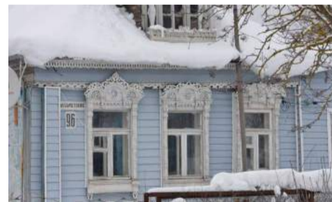
Хорлово, ул. Советская, д. 96

В «Записках о Московии», которые написал австриец С. Герберштейн в XVI веке, сказано: «Эта область изобилует рощами и лесами, в которых можно наблюдать страшные явления. Там и поныне очень много идолопоклонников, которые кормят у себя дома как бы пенатов, каких-то змей с четырьмя короткими лапами наподобие ящериц с чёрным и жирным телом, имеющих не более трёх пядей в длину и называемых гивоитами (Givuoites). В положенные дни люди очищают свой дом и с каким-то страхом со всем семейством благоговейно поклоняются им, выползающим к поставленной пище. Несчастья приписывают тому, что божество-змея было плохо накормлено».