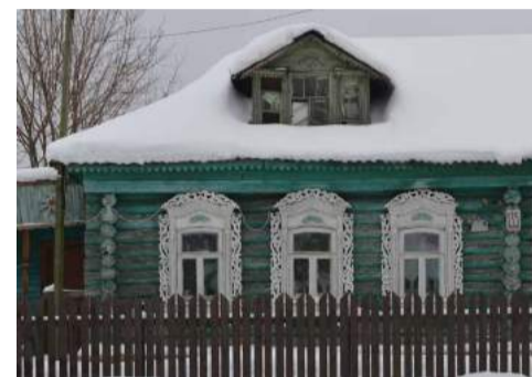
Хорлово, ул. Советская, д. 135

рез всю Европу, и многие из них были в Париже и других крупных городах того времени. Вернувшись, «русский мужик» решил воплотить увиденное на родине. Но поскольку камня на Руси не было, дома стали украшать деревянными резными наличниками, накладными балясинами и множеством других. Действительно: если внимательно рассмотреть этот наличник, можно заметить, что некоторые его детали больше характерны для каменной архитектуры, нежели для деревянной.