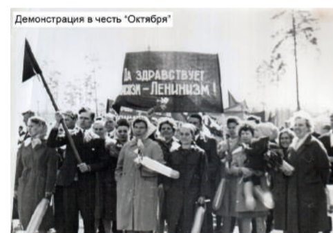
Демонстрация в честь «Октября»