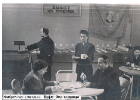
Фабричная столовая. «Буфет без продавца»