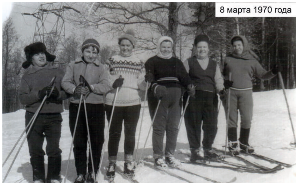
8 марта 1970 года