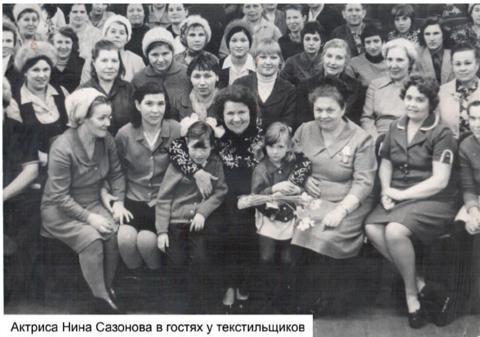
Актриса Нина Сазонова в гостях у текстильщиков

Но пока живы люди, которые поднимали нашу страну после ужасной войны с фашистскими захватчиками, строили и создавали все то, чем мы пользуемся до сих пор, нужно внимательно слушать их. Они – наша «живая история». Через их судьбы, воспоминания и рассказы мы пытаемся «прикоснуться» к тому времени.