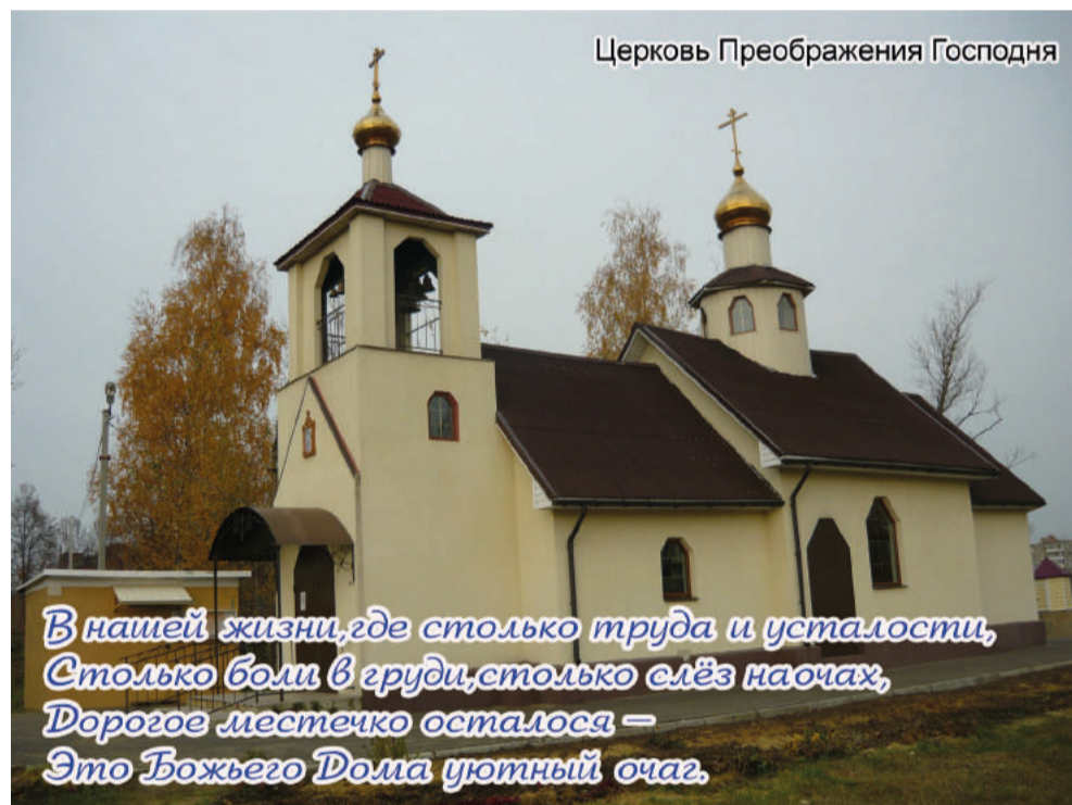
Церковь Преображения Господня

В забвении не будут эти имена. Пусть мчатся годы и десятилетия, Увековечила их школьная стена, Чтобы служить примером детям.